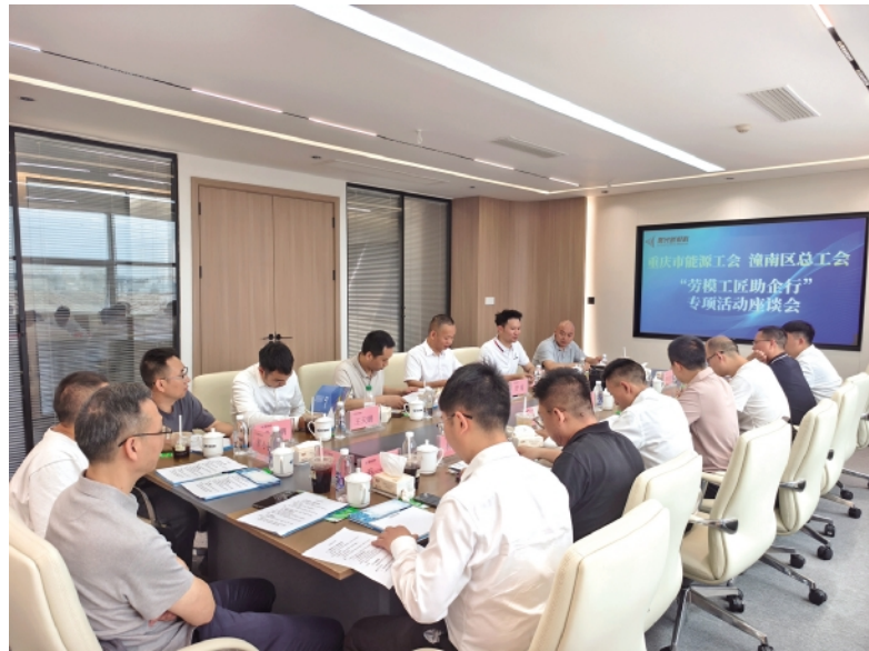
劳模工匠助企行——重庆聚光新材料座谈会

工匠们没有套话，从责任划分到费用组成，从过程管控到协作流程，一项一项拆解，一条一条明确。他们把多年积累的实战经验和“盘托出”，为企业理清了规范协作流程的优化